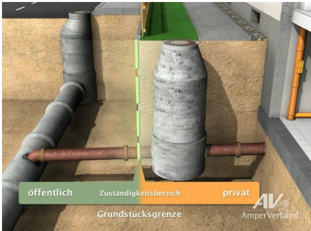
Zuständigkeitsbereich der Entwässerungsanlage

Um alle Beitragspflichtigen in gleichem Maße zu belasten, berücksichtigen wir bei der Berechnung des Herstellungsbeitrags, wer den Aufwand für den Grundstücksanschluss im öffentlichen Straßengrund – vom Ortskanal zur Grundstücksgrenze – getragen hat. Wurden diese Kosten von Ihnen oder einem Voreigentümer schon übernommen, gehen wir bei unserer Berechnung natürlich von einem abgestuften Beitragssatz je m 2 Geschossfläche aus.